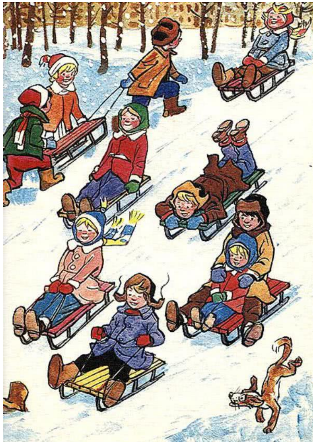
(Илл. И. Семёнова)

Котька отвязал коньки и взял лопату. — Засыпай песок снегом! Котька стал насыпать горку снегом, а ребята снова водой полили. — Вот теперь, — говорят, — замерзнет, и можно будет кататься. А Котьке так работать понравилось, что он еще сбоку лопатой ступеньки проделал. — Это, — говорит, — чтоб всем было легко взбираться, а то еще кто-нибудь снова песком насыплет!